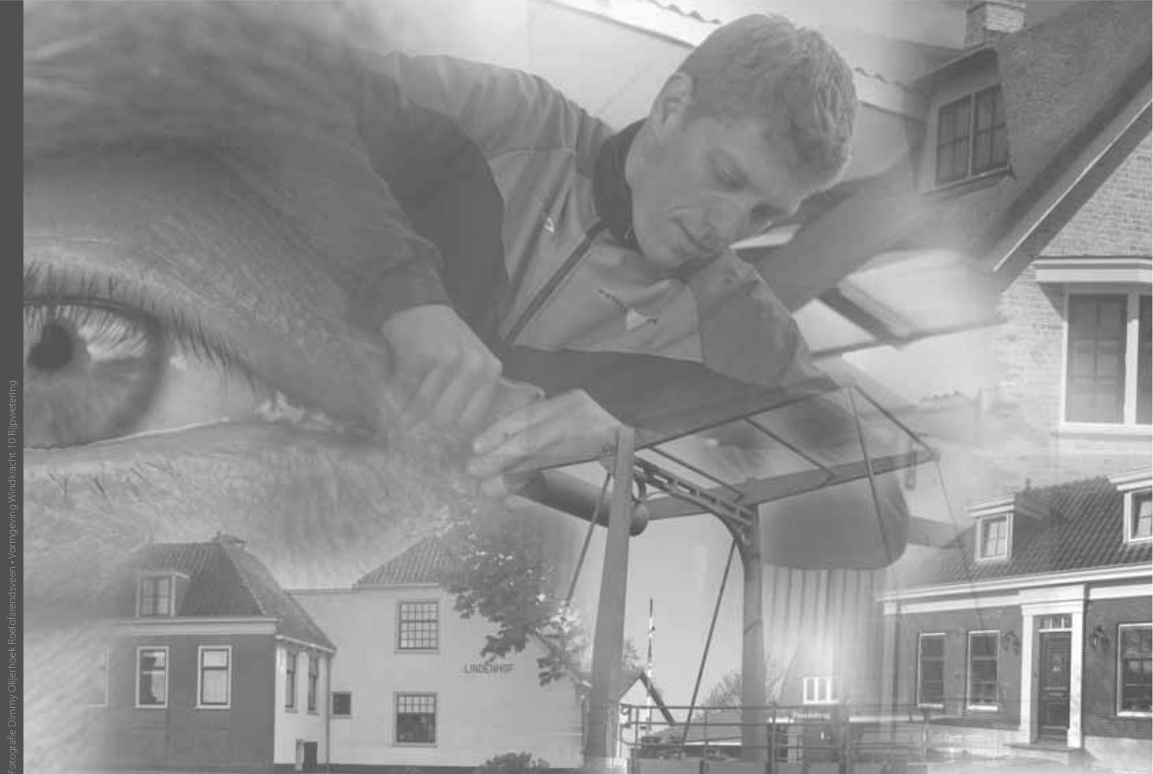
Vormgeving Windkracht 10 Rijkswatering